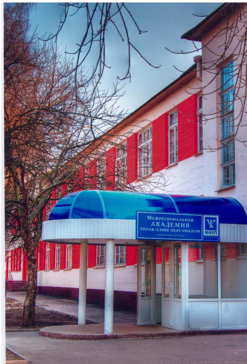
Мал.2 Зовнішній вигляд будівлі.

Стан матеріально - технічної бази Харківського інституту МАУП та стан соціальної сфери: